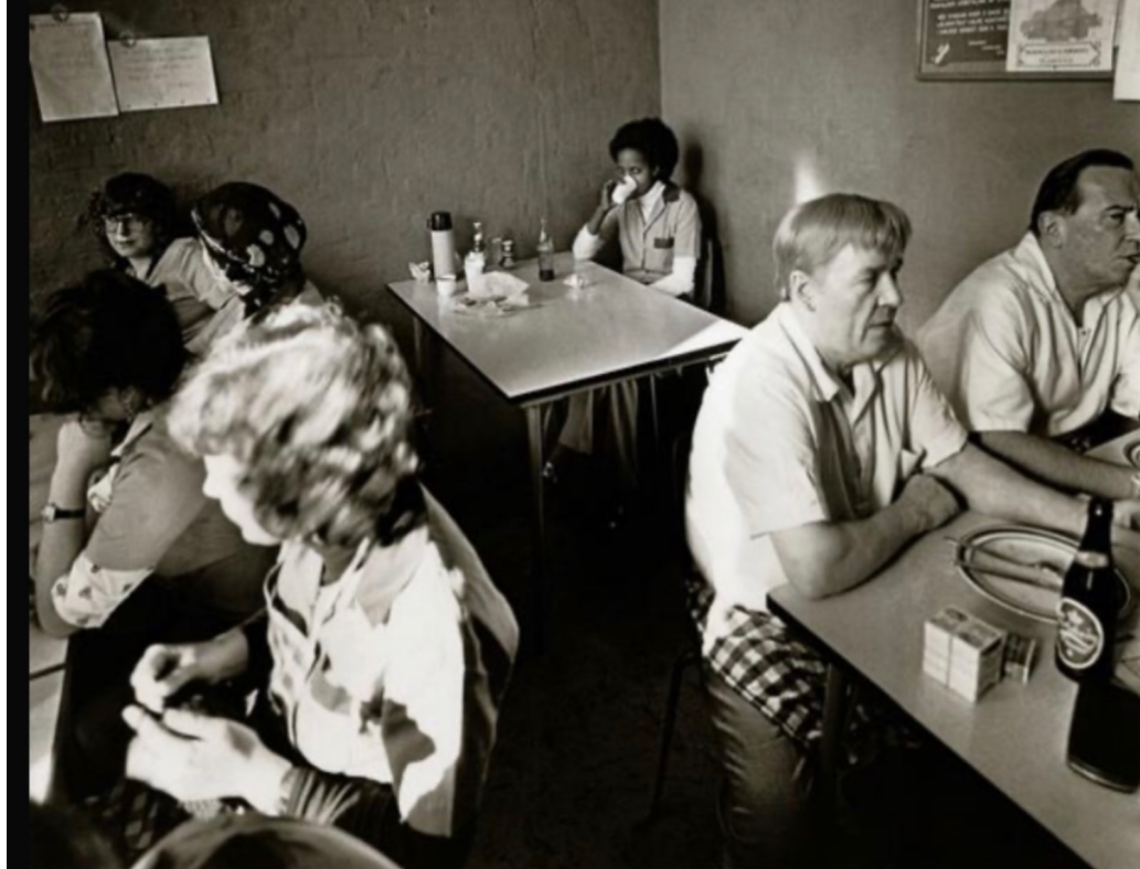
Allerede i 1980 havde nogle danskere det svært med de 'fremmede'. Chokoladefabrik i Sydhavnen.