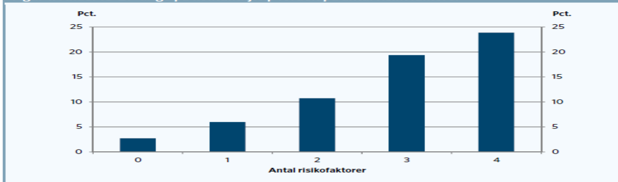
Figur 1. Andel 18-29-årige på kontanthjælp fordelt på antal risikofaktorer