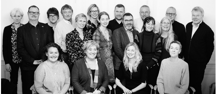
Foreningen Center for Ungdomsforskning bestyrelse 2017