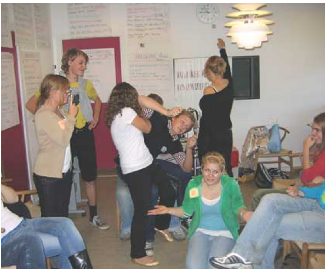
FOTO: Kritikbillede Miljø og indretning

Som det fremgår af disse to lister over stikordene i kritikfasen og fantasifasen, havde fantasifasen således i nogen grad karakter af en antitese til kritikfasen.