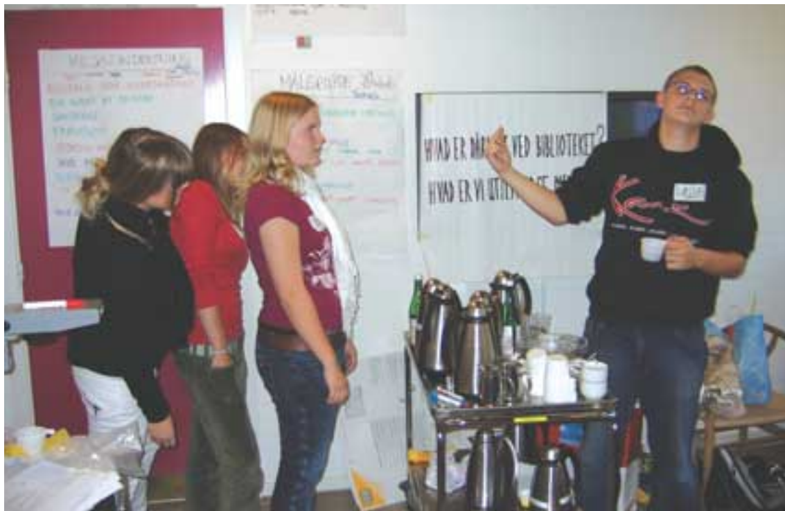
FOTO: Kritikbillede Service og bibliotekarere