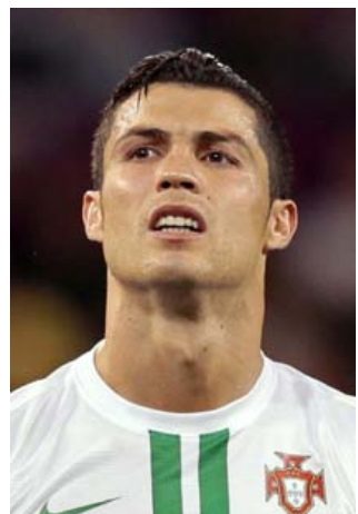
DRØMMELAND. Ronaldo vil gerne spille fodbold i USA.