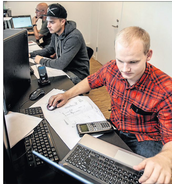
Erhvervsuddannelserne vinder indpas hos de unge, mens færre søger ind på universiteterne.

Uddannelsesminister Sofie Carsten Nielsen (R) glæder sig da også over skiftet: