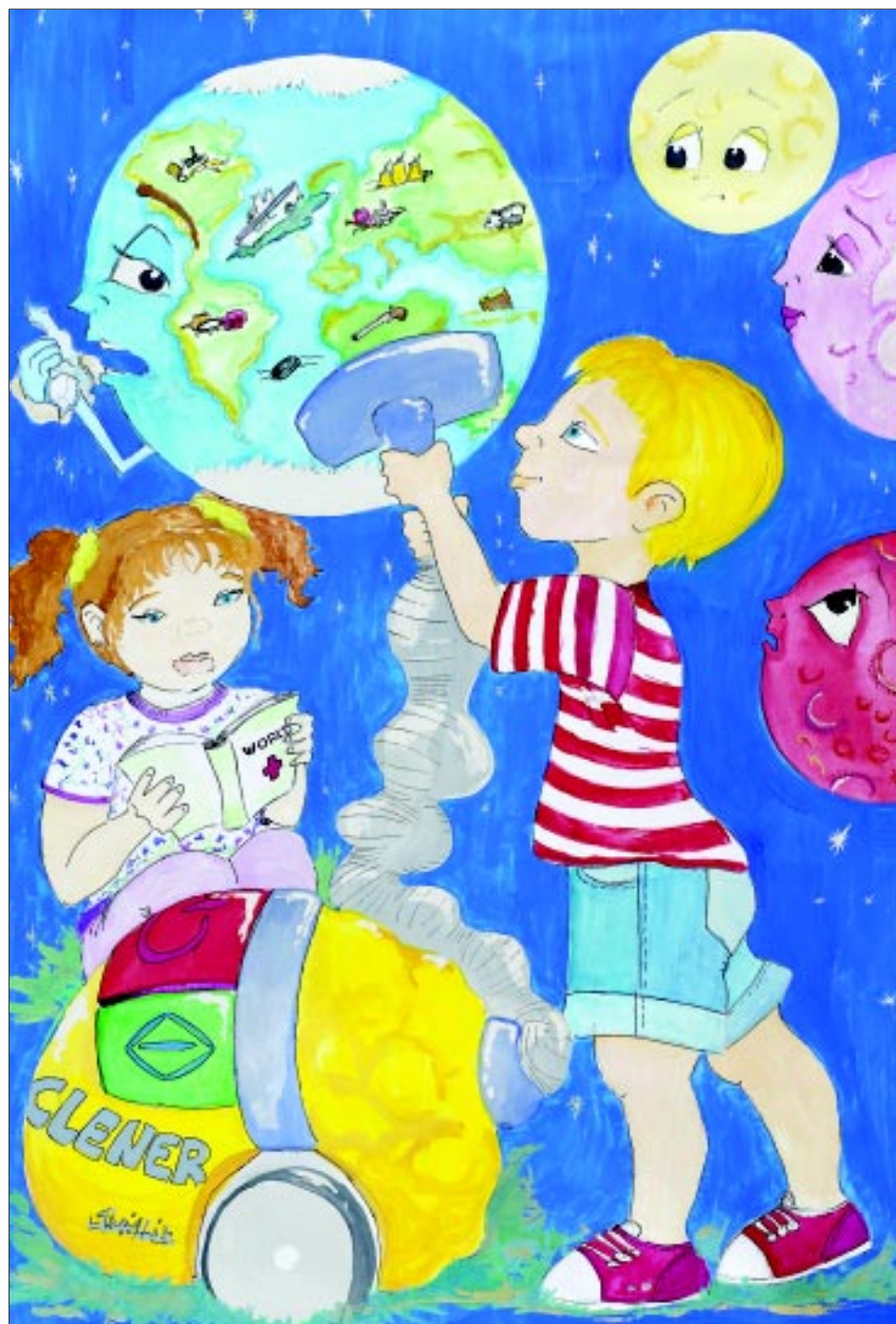
Judit Szécsi og Anita Gutti, 13 - Szeged, Ungarn, 2002