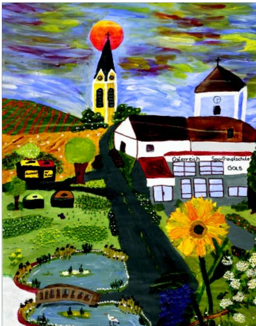
Klasse, ca. 14 år - Sporthauptschule Gols, Østrig, 2002

Mens de to drenge fra Litauen har medtænkt hele kloden i deres plakat, er der andre unge, der udtrykker en forståelse af miljøbegrebet