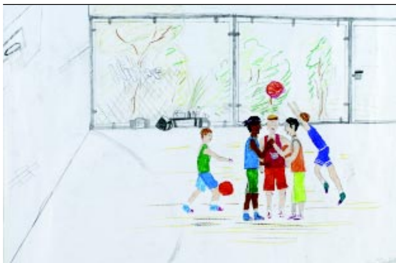
Vera Tönsfeldt, 13 Büdelsdorf, Tyskland, 2002