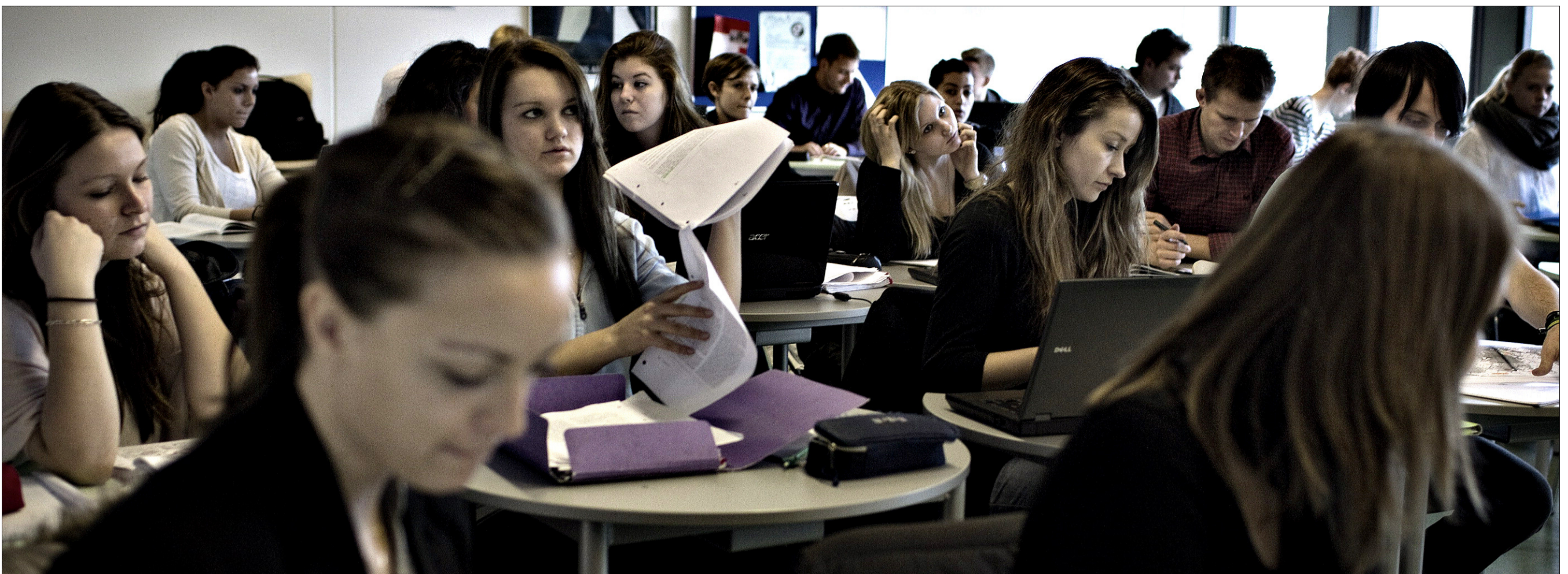
VOKSENUDDANNELSE. Bag dagens analyse ligger en omfattende undersøgelse, som viser, at 9 ud af 10 hf-kursister er tilfredse med uddannelsens faglige indhold. Hf-uddannelsen har simpelt hen givet eleverne en 'second chance'.