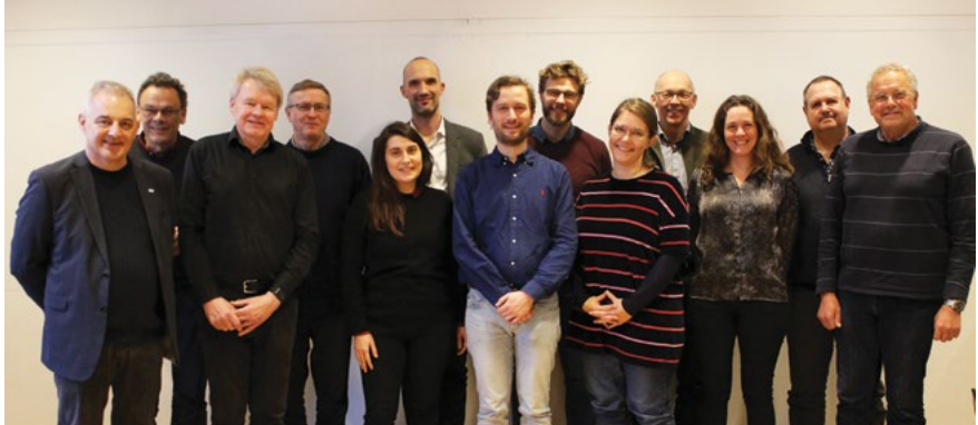
Foreningen Center for Ungdomsforskning bestyrelse 2019

meget tid og koordinering at arbejde i og på tværs af de store forskningsundersøgelser. 2019 har således været et år, hvor Centerets forskere har været dybt nede i forskningsarbejdet med analyser af det empiriske materiale, skrevet artikler og arbejdet frem mod forskningspublikationerne.