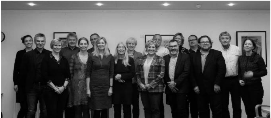
Foreningen Center for Ungdomsforsknings bestyrelse 2018